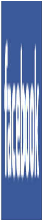
Crea tu insignia