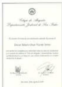
Diploma por 25 años de Abogado en el Colegio de Abogados de San Isidro

¿Porqué será que esta canción me hace acordar a ciertos personajes de San Isidro?