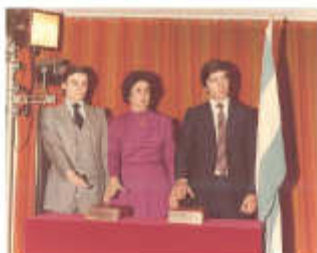
Abril de 1982: Jura en la Universidad de Belgrano