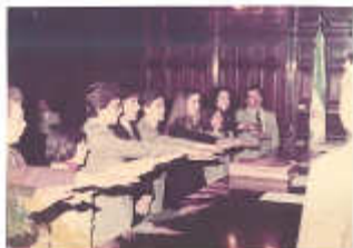
25 de Agosto de 1982: Jura en la Corte Suprema de Justicia de la Nación